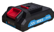
Chargeur rapide de batterie 20V Li-Ion