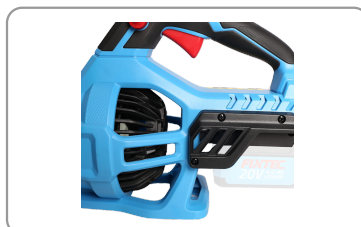
Moteur sans balais de charbon.