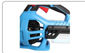
Moteur sans balais de charbon.