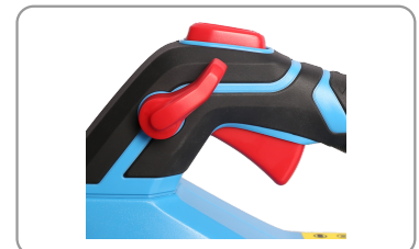
Mode turbo pour un gain de puissance supplémentaire.