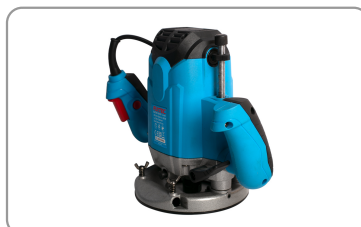
Base en aluminium avec patin de glisse.