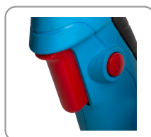
Réglage de la vitesse par pression sur la gâchette de démarrage.