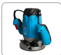
Base en aluminium avec patin de glisse.