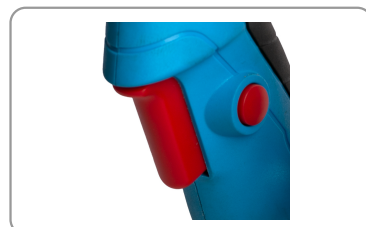
Réglage de la vitesse par pression sur la gâchette de démarrage.