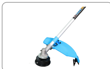
Bobine de fil à alimentation semi-automatique.