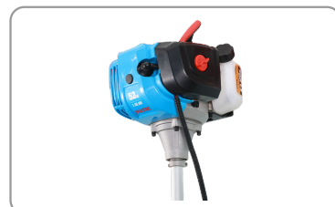
Moteur thermique 2 temps de 52 cm.