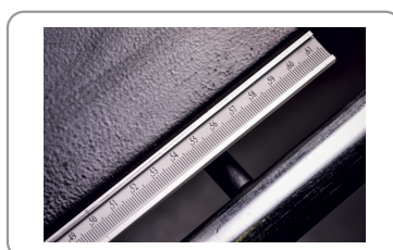
Geleider voor doorzagen in de lengte met micrometer afstelling