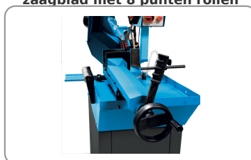
Snel aan te spannen spantang met hendel voor spelingcompensatie