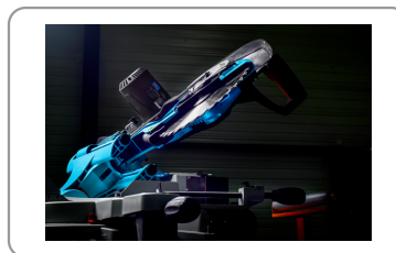
45° kantelbare kop naar rechts en links