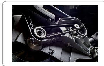
Transmissie met riem