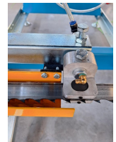
Guide de lame avec buse pour liquide de refroidissement