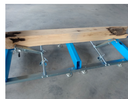
Systeem voor het bijhouden van houtblokken