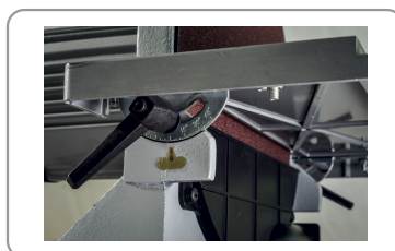
Tafel, kan tot 45° hellen