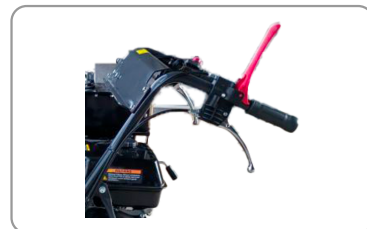
Poignée de sécurité "homme mort"