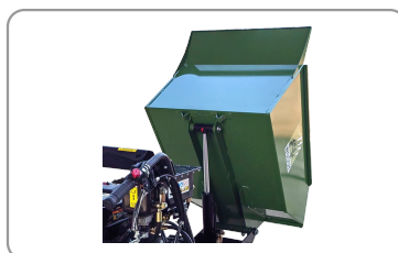
Benne à basculement hydraulique