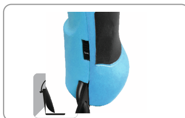
Molette de réglage.