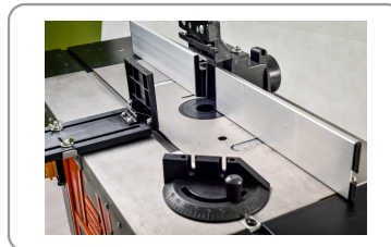
Tafel in gietstaal