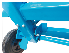
Interverrouillage du chariot de coupe et du protecteur supérieur.