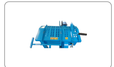
Afscherming bovenkant met afstelbare handgreep