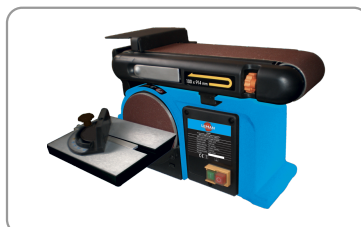
Tafel in gietaluminium, kan tot 45° hellen