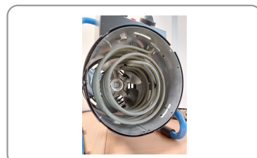
2 résistances indépendantes de 1500w chacune