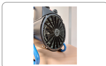
Ailettes canalisant le flux d'air