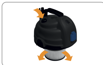
Manuele ontstopping filter