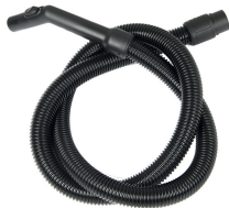
Gemengde stof- en vloeistoffenzuigmond 300 mm