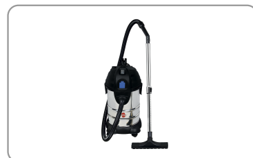
Synchronisatie voor elektrische machine maxi 1800w