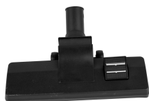
Tuyau flexible d'aspiration (2m)