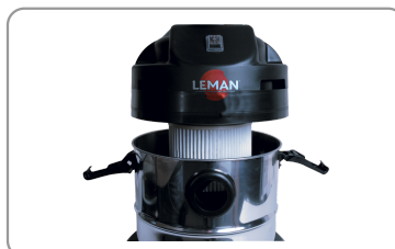
Permanent filter in wasbare houder