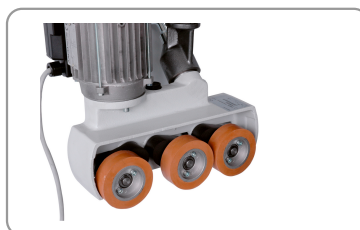
3 rollen van Ø 80