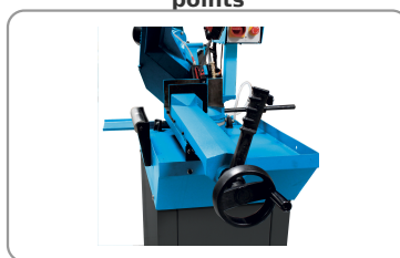
Étau à serrage rapide avec levier à rattrapage de jeu