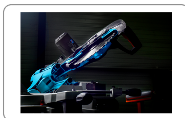
Tête inclinable de 45° à droite et à gauche