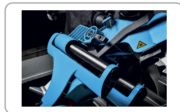
Tête avec coulissement radial