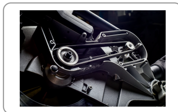
Transmission par courroie