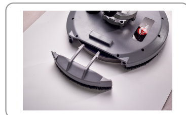
Partie détachable du plateau pour les angles