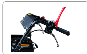
Poignée de sécurité "homme mort"