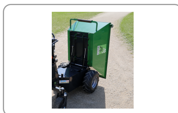
Benne à basculement manuel assisté par vérins à gaz