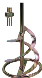
Turbine Ø 160 mm à deux branches