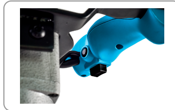
2 modes de vitesse : lent / rapide