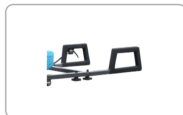
Poignées avec revêtement grip