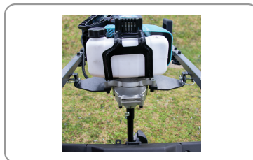
Montage du bloc moteur sur pivots