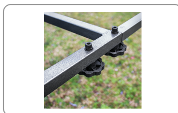
Châssis démontable sans outil