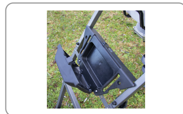
Boîtier de rangement des accessoires