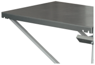
Rallonge de table 550x800mm