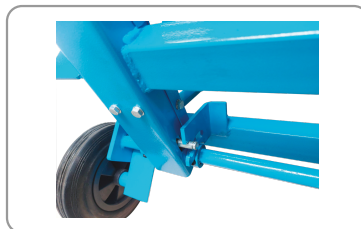
Interverrouillage du chariot de coupe et du protecteur supérieur.