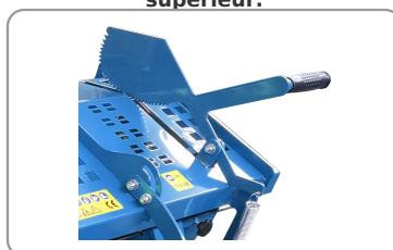
Protecteur supérieur avec poignée réglable et griffe de maintien de la bûche