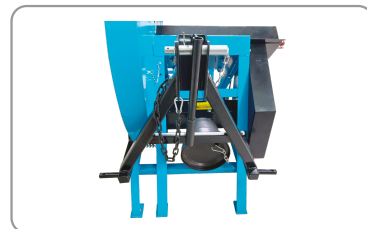
Attelage 3 points et entraînement sur prise de force.