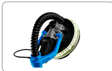
Eclairage led sur la tête de ponçage.