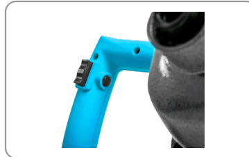
Bouton de déverrouillage