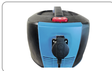
Prise synchronisée pour appareil électroportatif