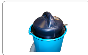
Poignée de transport