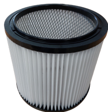
Filtre plissé HEPA