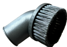
Brosse ronde (Ø38mm)