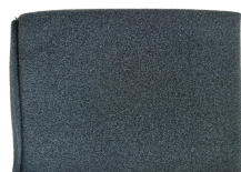
Filtre en mousse pour liquides