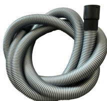
Tuyau flexible d'aspiration (4m)