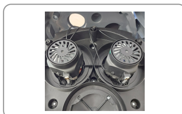
2 moteurs à refroidissement by-pass montés en parallèle