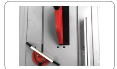
Guide d'angle réglable à 45°.