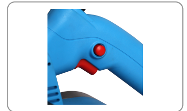
Molette de centrage de la bande.