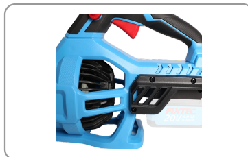
Moteur sans balais de charbon.