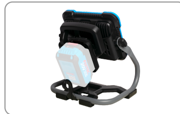
3 niveaux de luminosité 1100, 2000 et 2700 lm.