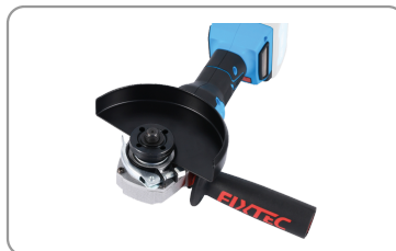
Témoin de charge.