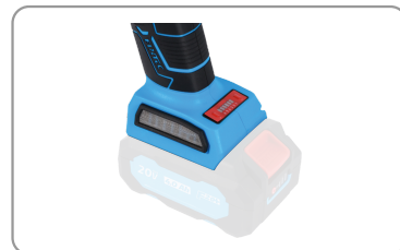
Carter de protection pour meulage avec fixation à serrage rapide.