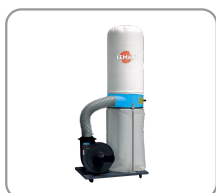
Sac de filtration en feutre