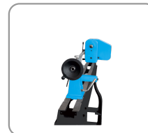
Poupée fixe et mobile percée à 10 mm