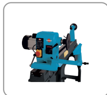
Rotation de la tête jusqu'à 180°