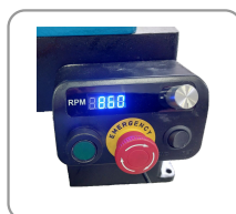
Boîtier de commandes magnétique