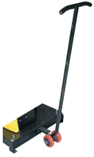
Kit de déplacement