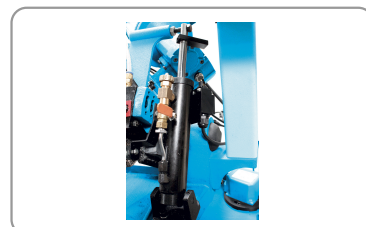
Descente de l'archet par vérin hydraulique avec débit réglable