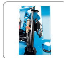
Descente de l'archet par vérin hydraulique avec débit réglable