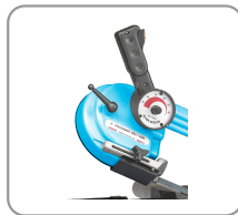
Variateur de vitesse, détente rapide de la lame