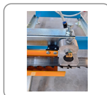
Guide de lame avec buse pour liquide de refroidissement