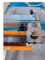
Guide de lame avec buse pour liquide de refroidissement