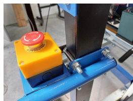
Bouton darret durgence