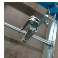
Griffe de maintien à serrage excentrique