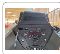
Moteur de 25 cv à démarrage électrique