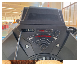
Moteur de 25 cv à démarrage électrique