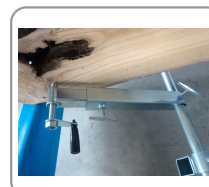
Système de maintien de grume