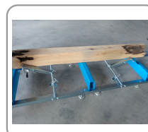
Système de maintien de grume