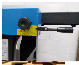
Réglage de la table d'entrée par levier excentrique