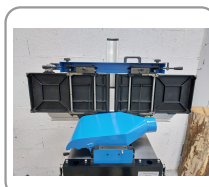
Ouverture des tables en une seule opération