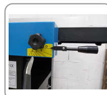
Réglage de la table d'entrée par levier excentrique