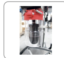
Carter de mandrin basculant et réglable