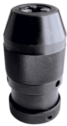
Mandrin auto-serrant B18 de 1 - 16 mm