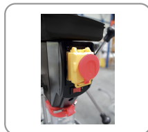
Bouton d'arrêt d'urgence coup de poing