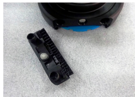
Brosse de nettoyage intégrée