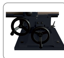
Double chariotage latéral et longitudinal sur queue daronde