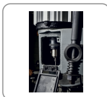
Système de mandrin pour fixation de la mèche